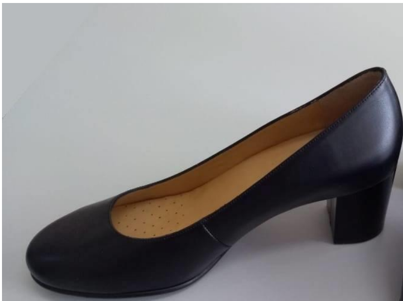
ΦΩΤΟΓΡΑΦΙΑ ΕΠΙΣΗΜΟΥ ΔΕΙΓΜΑΤΟΣ

Για το ύψος της φτέρνας το βήμα αύξησης ανά μέγεθος ορίζεται 0,1 cm.